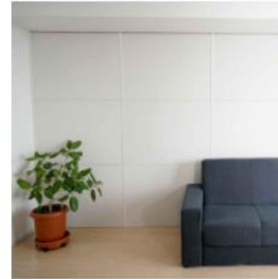
▲『ワンタッチ防音壁』ジョイナー。

『ワンタッチ防音壁』は、既存の壁に簡単に設置できる防音対策です。室内外に漏れる音の大きさを半減させる効果があり、費用は工事をした場合のおよそ3分の2で済みます。