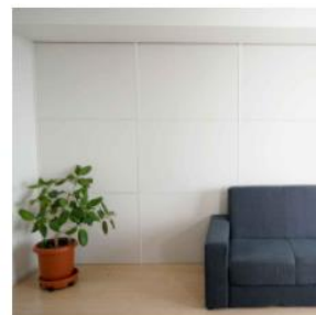
▲『ワンタッチ防音壁』ジョイナー。

『ワンタッチ防音壁』は、既存の壁に簡単に設置できる防音対策です。室内外に漏れる音の大きさを半減させる効果があり、費用は工事をした場合のおよそ3分の2で済みます。